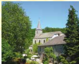
Eglise de Lompret / Kerk van Lompret