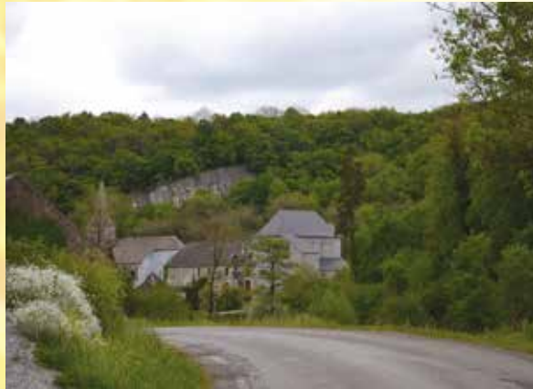
La falaise de Lompret - Het flif van Lompret

In de rue G. Sellière moet u een kijkje nemen bij het huis nr. 12. Het dateert uit de 18 e eeuw en is opgenomen als 'Uitzonderlijk Erfgoed van het Waalse Gewest'. Het is een zogenaamd drieluig pand (of 'de la Caestienne') vanwege de samenstelling: stallingen/hangar/hoofdgebouw. Voor de bouw werd breuksteen en kalksteen gebruikt.