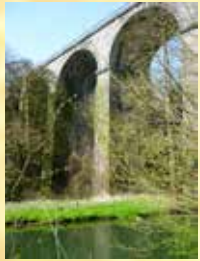
Le viaduc de l'Eau Blanche Het viaduct van l'Eau Blanche