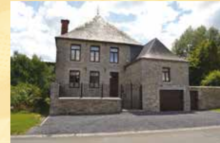
Maison Moëllons - 1749

Le plateau de Longtemchamps (dont l'origine est probablement loutains champs ou champs éloignés) est un plateau schisteux d'environ 1700m de long et de 300 à 400m de large. C'est sur cette propriété communale que les Princes de Chimay avaient fait établir un golf à 9 trous.