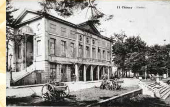
Le Casino en 1916

En rejoignant le centre de Chimay, vous découvrirez la chapelle St Ghislain (4) récemment restaurée, dédiée à St Ghislain que l'on invoquait autrefois pour éviter les convulsions chez les nouveau-nés.