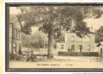
Gare de Seloignes

De nos jours, la ligne 156 est aménagée en RaVeL par phases successives , reliant ainsi Momignies, Macon, Seloignes, et Villers-la-Tour pour poursuivre vers Mariembourg via le centre-ville de Chimay.