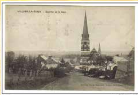
Quartier de la gare

Vandaag is lijn 156 in verschillende fasen heeraangelegd als RaVeL en verbindt Momignies, Macon, Seloignes en Villers-la-Tour, om dan verder te gaan naar Mariembourg via het stadscentrum van Chimay.