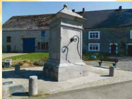
La pompe de Baileux - De pomp van Baileux

In het dorpscentrum van Baileux staat nog een monumentale pomp uit de 18 e eeuw. U ontdekt er ook tal van huizen in breuksteen die op de bovendrempel een monogram en een jaartal dragen. Let ook op de toegangspoorten van schuren die vaak cijfers van jaartallen tonen in smeedijzer. Een wandeling door de straatjes van het dorp onthult verschillende fraaie panden, waarvan er een aantal op de monumentenlijst staan.